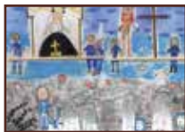
TERCERO Vega Blanco Fernández Colegio San Vicente de Paul